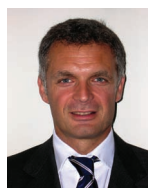
Massimo Della Ragione CEO Goldman Sachs Italia